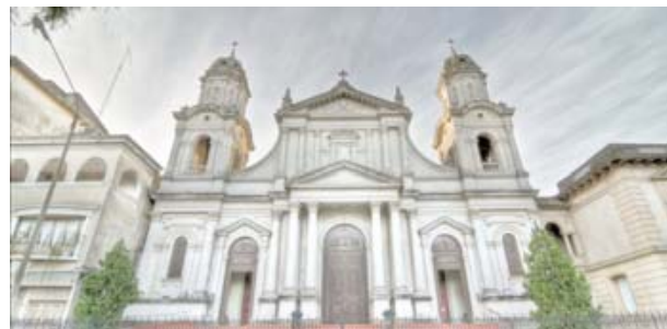
PARROQUIA SAN JUAN BAUTISTA

Sábado 10 17:00. Capilla San Roque (Hipódromo). 19:00. Templo Catedral-Basilica Domingo 11 09:00. Capilla Virgen de los 33 (Col. 18 de Julio). 11:00. Templo Catedral-Basilica. 17:00. Capilla Ntra. Sra. de Fátima (Cervantes y Morquio). 19:00. Templo Catedral-Basilica.